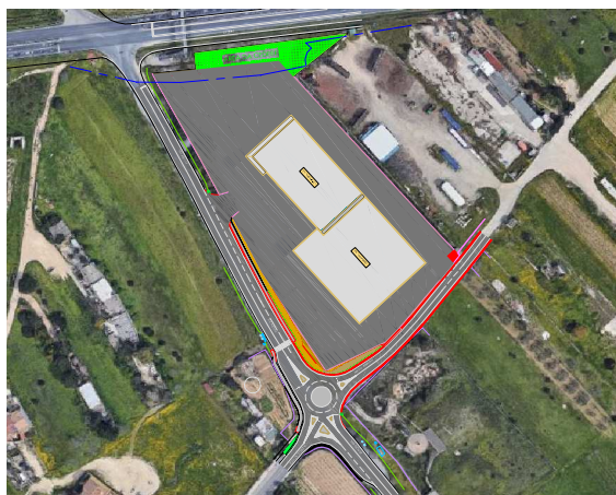
Aerofoto Google Maps

MD Immobiliare S.p.A. Zona Industriale A.S.I. - Capannone 18 - Gricignano di Aversa (CE)