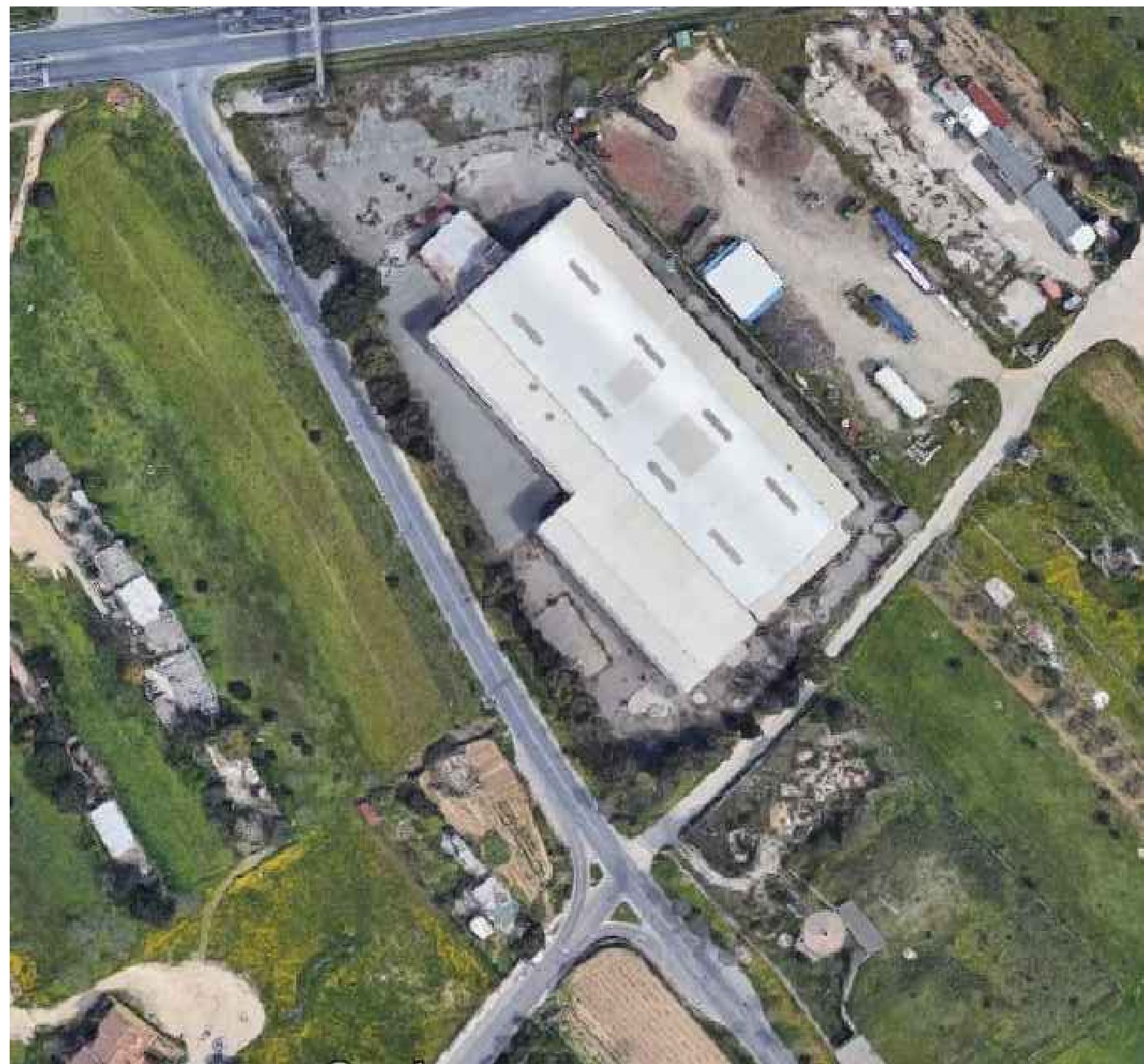
VISTA AEREA SCALA 1:1.000