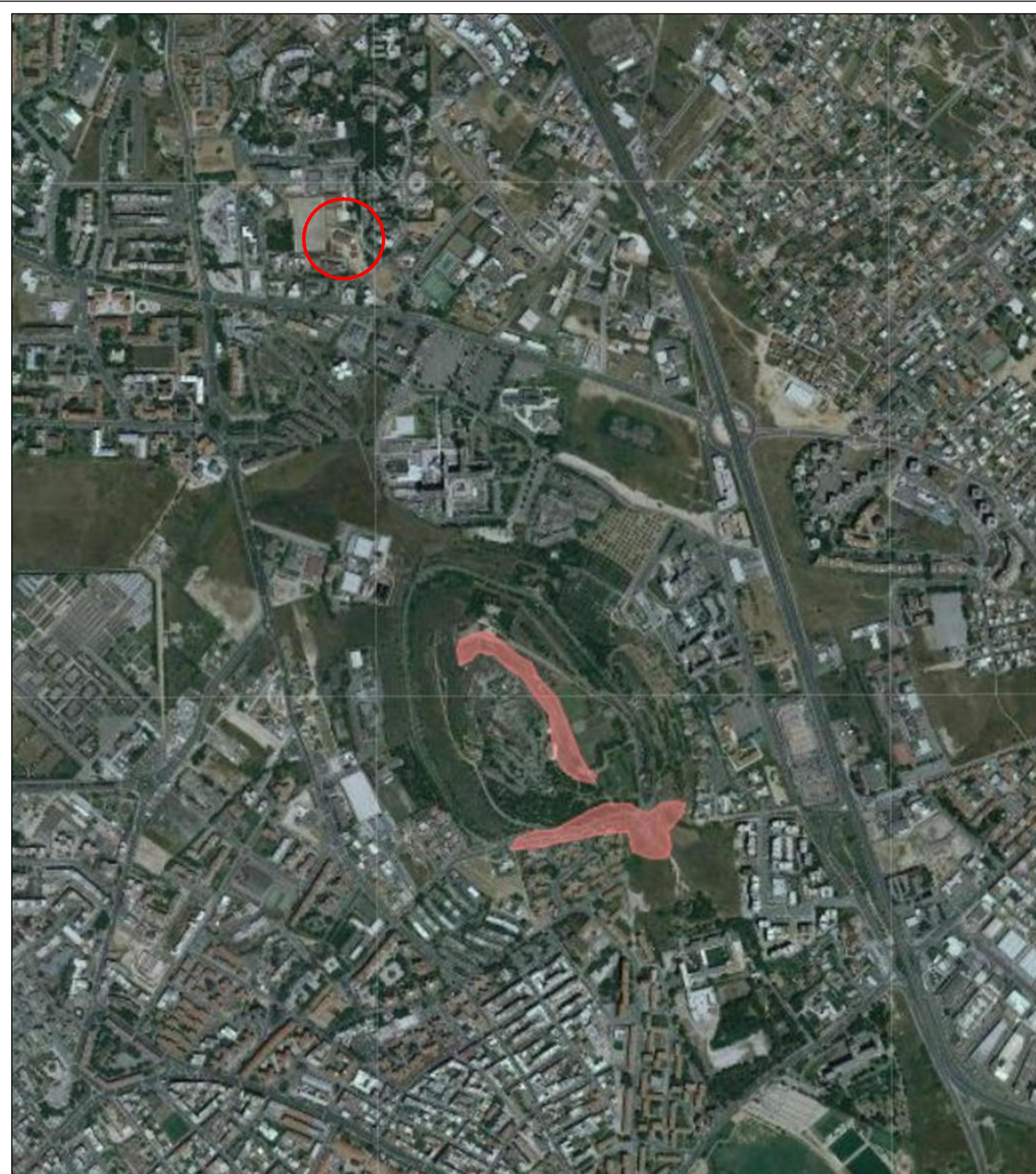
Stralcio PAI - Scala 1:10000