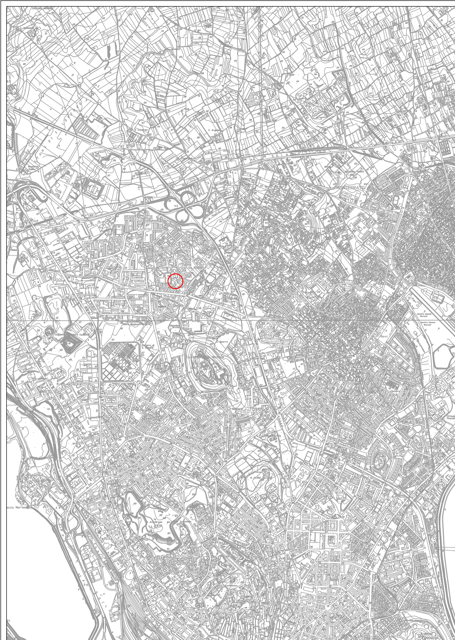
Corografia (CTR) - Scala 1:25000